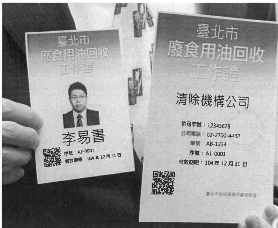
環保署公布廢食用油回收工作證樣式1031119